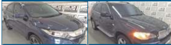
HR-V EX CVT