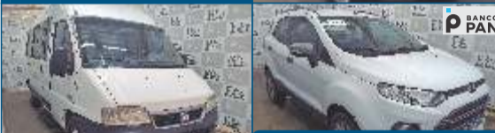
ECOSPORT FSL AT1.6

200 VEÍCULOS Dia: 22.10.2021 - 6ª FEIRA - 10h00 Visitaçao: 21.10.2021 das 13h00 às 17h00